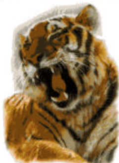
Встреча с раненым тигром