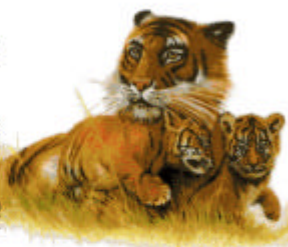
Самка, которая защищает своих детенышей