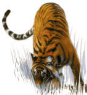
Тигр, который охотится за собакой, бегущей к хозяину