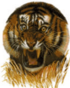
Встреча с тигром лоб в лоб